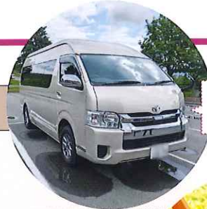
2名以下の場合は小型タクシーとなります