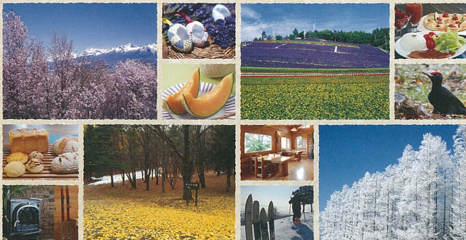
Hokkaido Nakafurano Hokusei yama

息をのむパノラマも、心安らく静かな森も、おとぎ話のような花畑も、この小さな山で出会う何気ない日常の風景です。